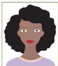
Figura 1. Modelo de Foto Frontal.