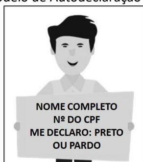
Figura 3. Modelo de Autodeclaração para o vídeo.